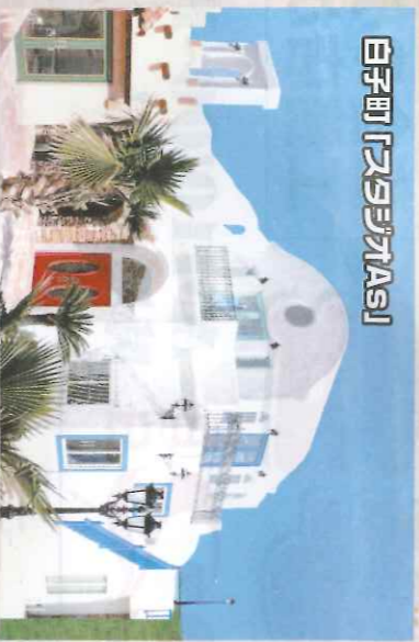
白子町「スラジカス」