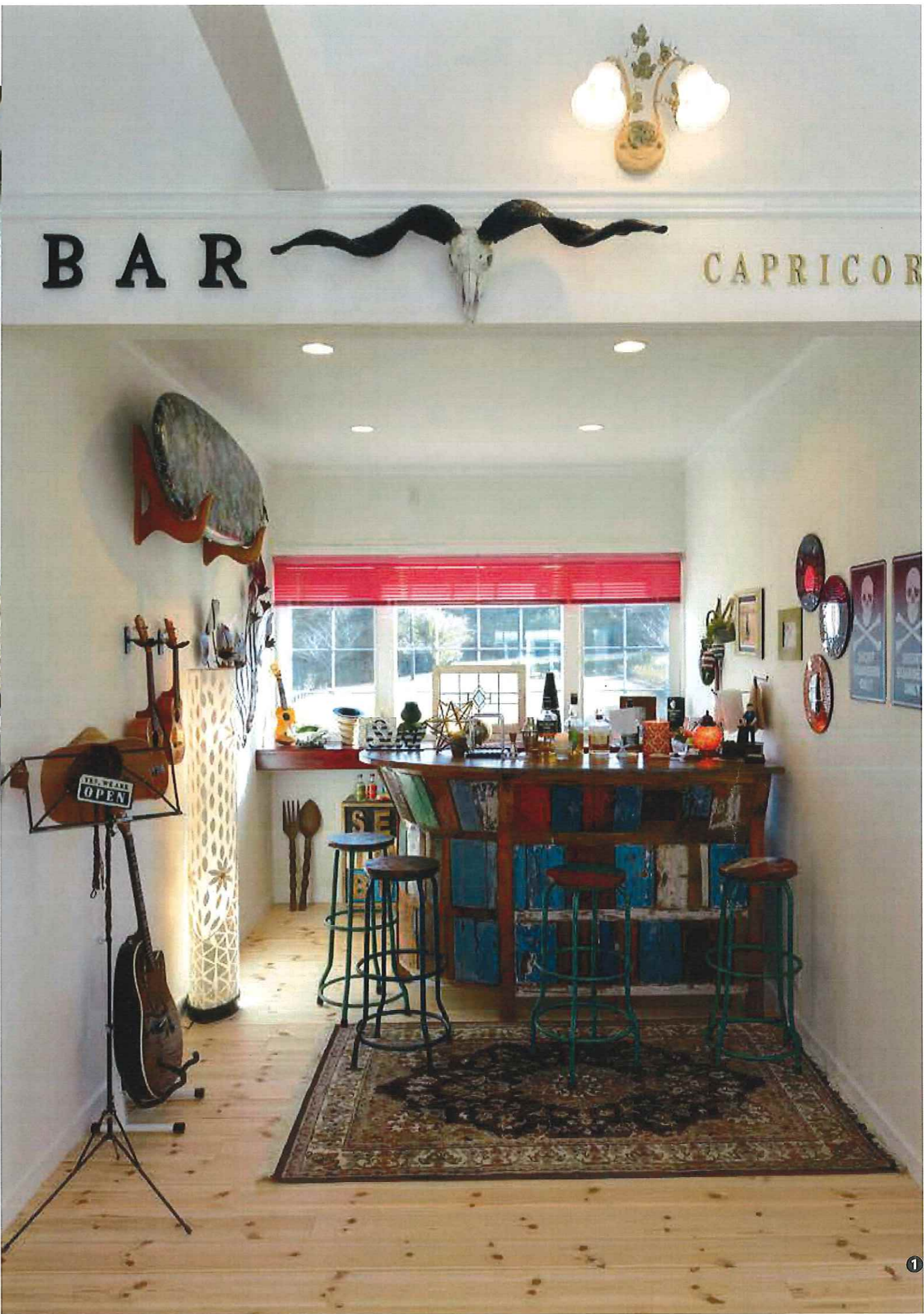
①奥様の星座を表したバー「カプリコーン」は乾いた風が吹き渡るようなカリフォルニアスタイルで ②となりのパーティールームは一転アジアチックなバリスタイル。天井や柱の木の現わしを削りダメージを与えて風合いを出した