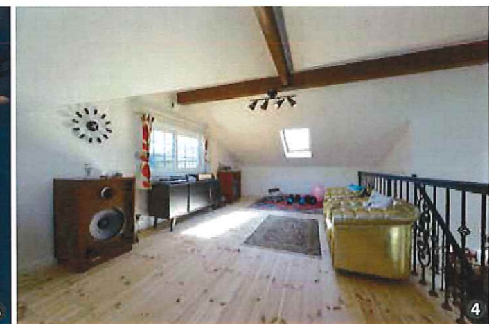
④ 大きな吹き抜けの上にはロフトではなく2階の居室とした。完璧な音響設備を置いた自由スペース。この場所から窓を通して遠くに海も見える ⑤ バスルームには輸入ジャクジーとシャワーブースを分けて配置した